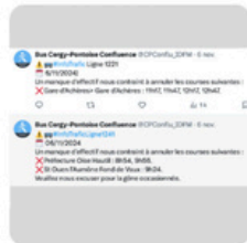
Mise en concurrence : Dysfonctionnements, conditions de travail et services dégradés