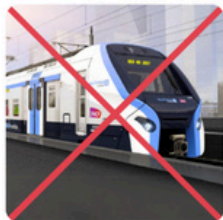
Retard des livraisons des nouvelles rames du RER