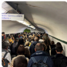
Les JOP sont finis, le chaos fait sa rentrée dans les transports franciliens